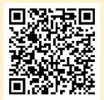
「ラーケーションの日」活動例